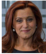
Me Gabrielle Azran Azran & associés avocats inc. Montréal