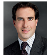
Me Éric Oliver Municonseil Avocats Inc. Montréal